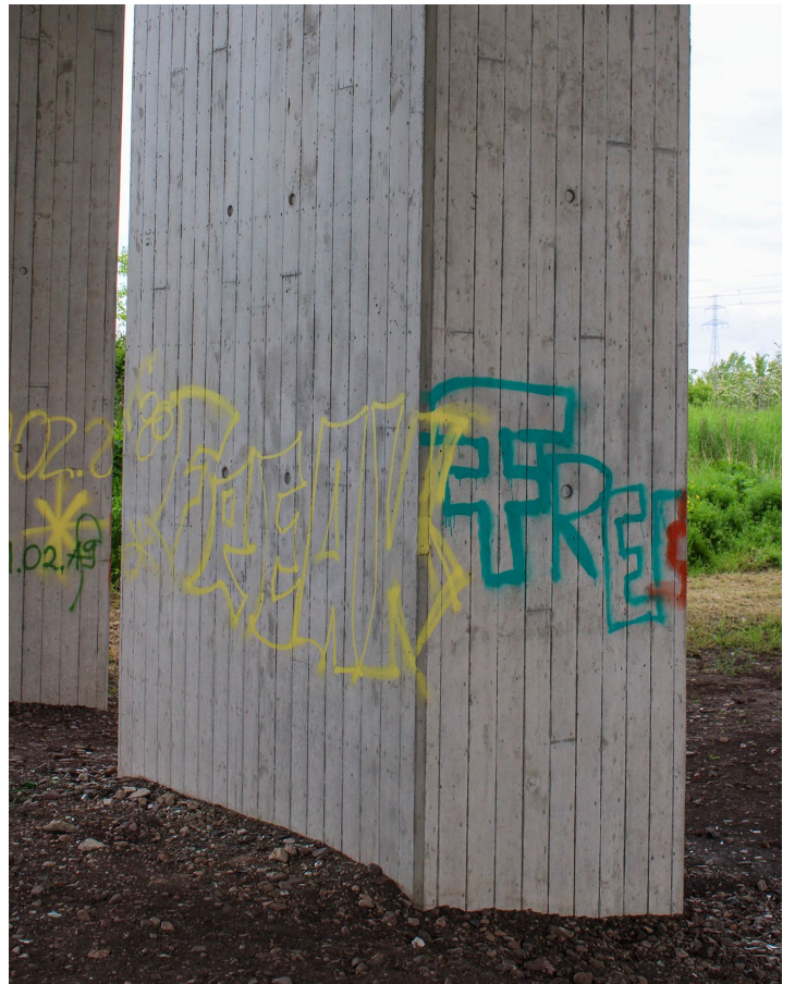
Länge-Breite / 210x110cm