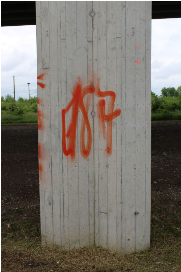
Ansicht Aussenfeiler 1, 6, 7, 12, 13, 18